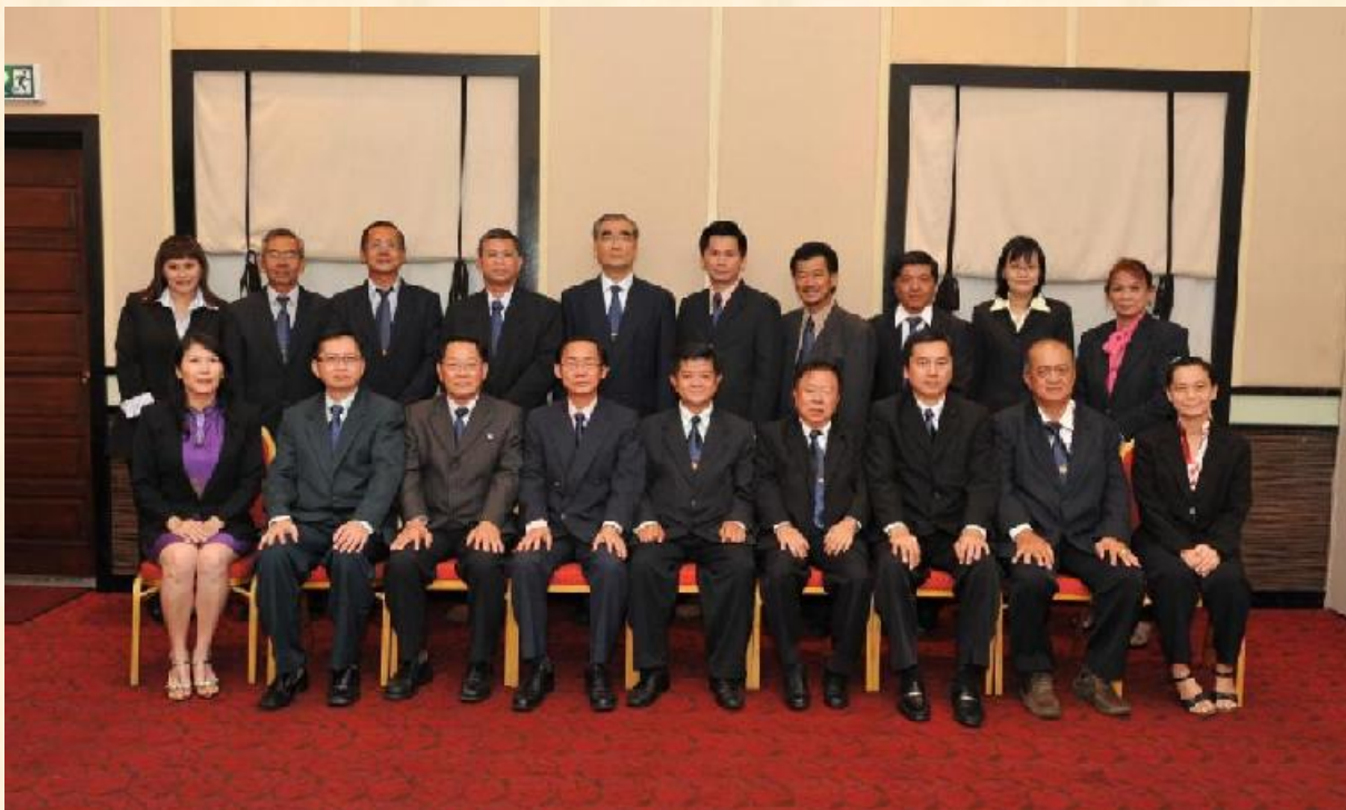
家教协会理事合照