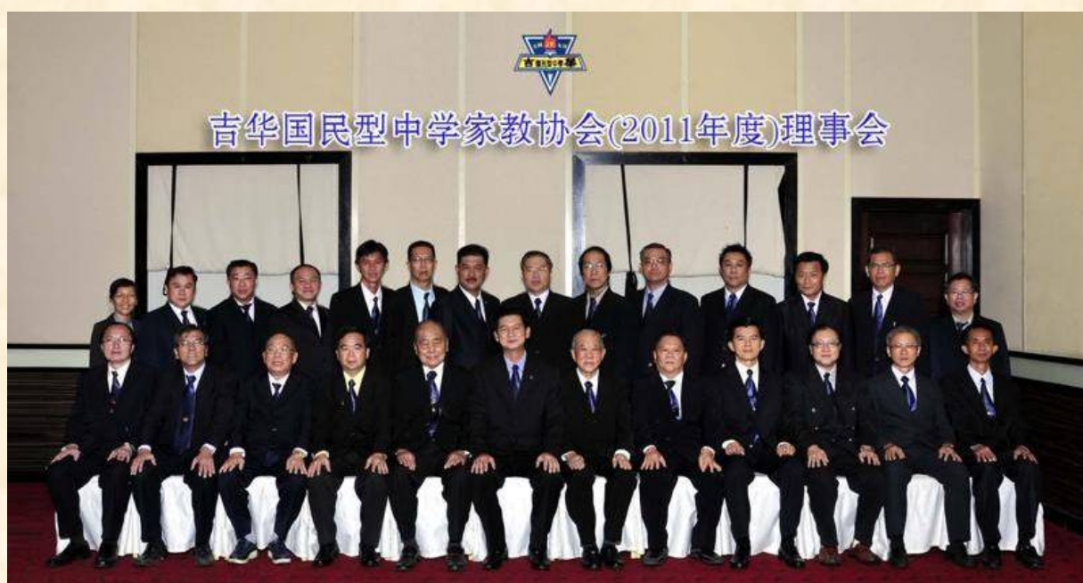
家教协会理事合照