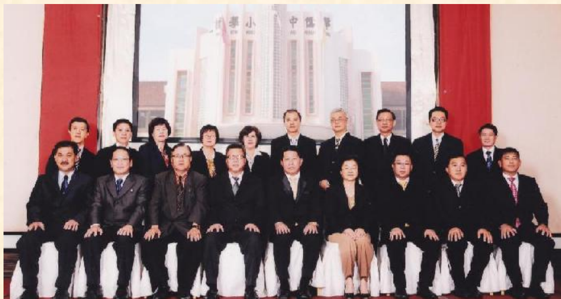
家教协会理事会合照