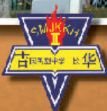
吉 华 国 民 型 中 学 二 校