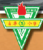
吉华(S)国民型华文小学