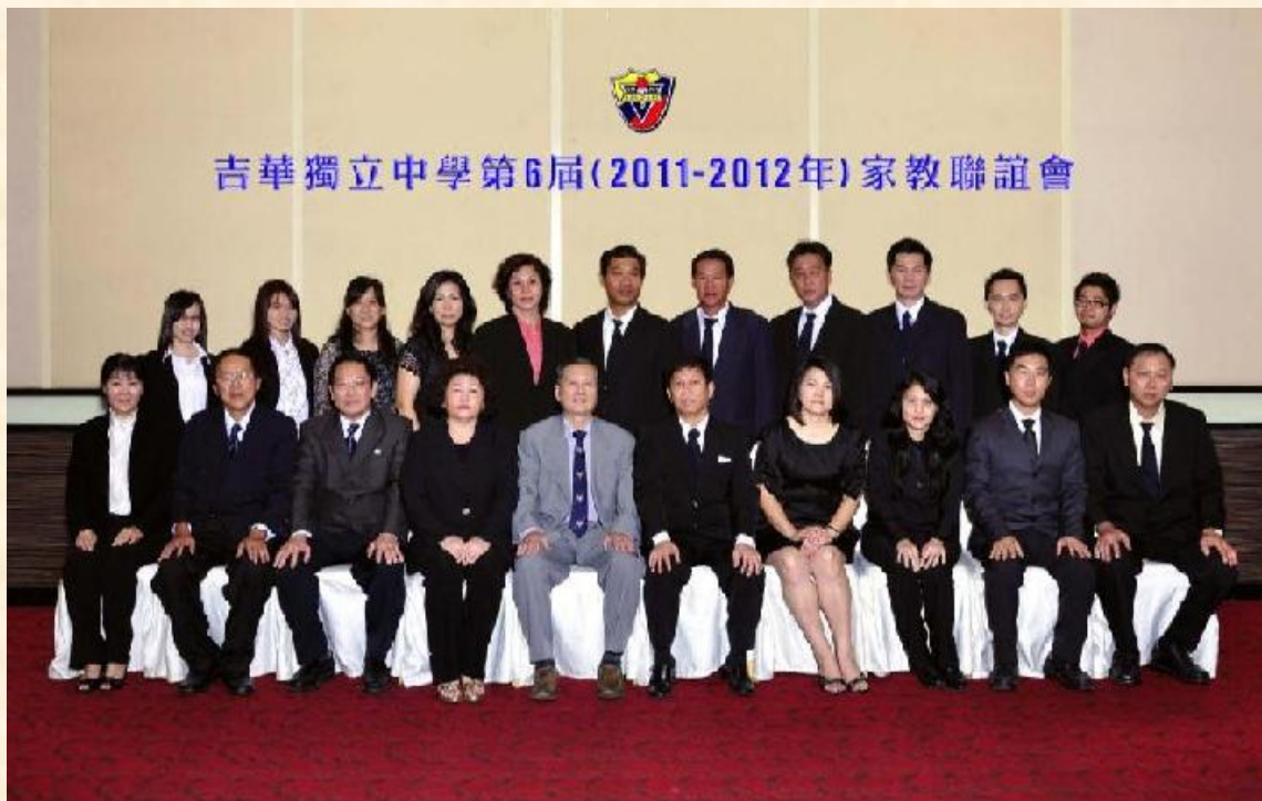
家教联谊会全体照