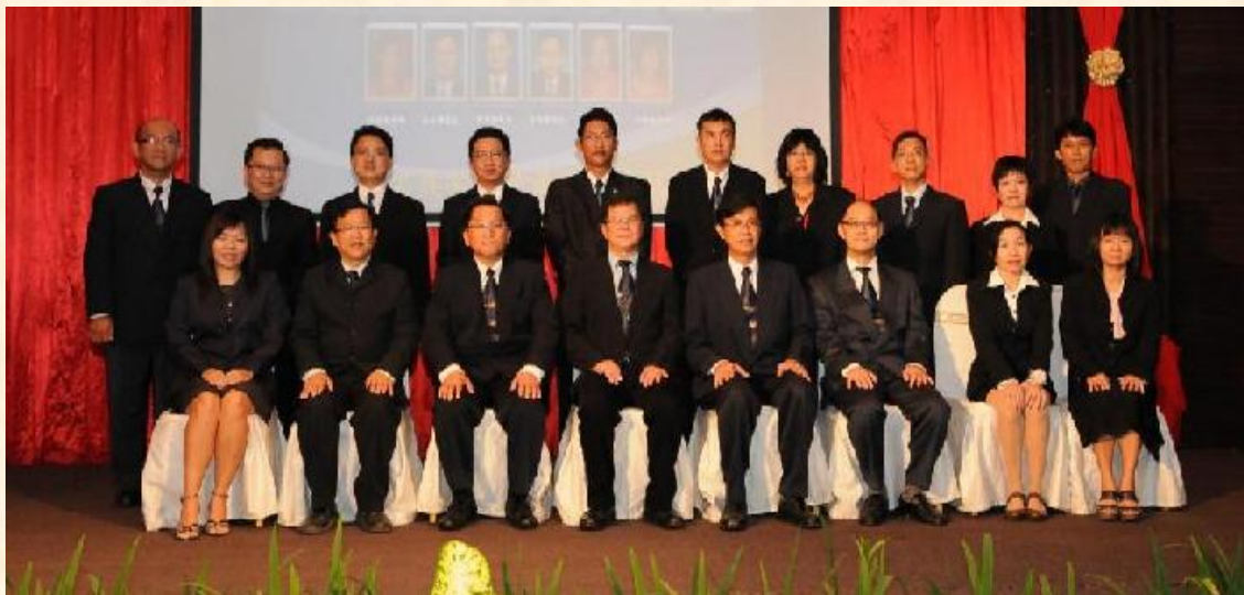
家教协会理事会合照